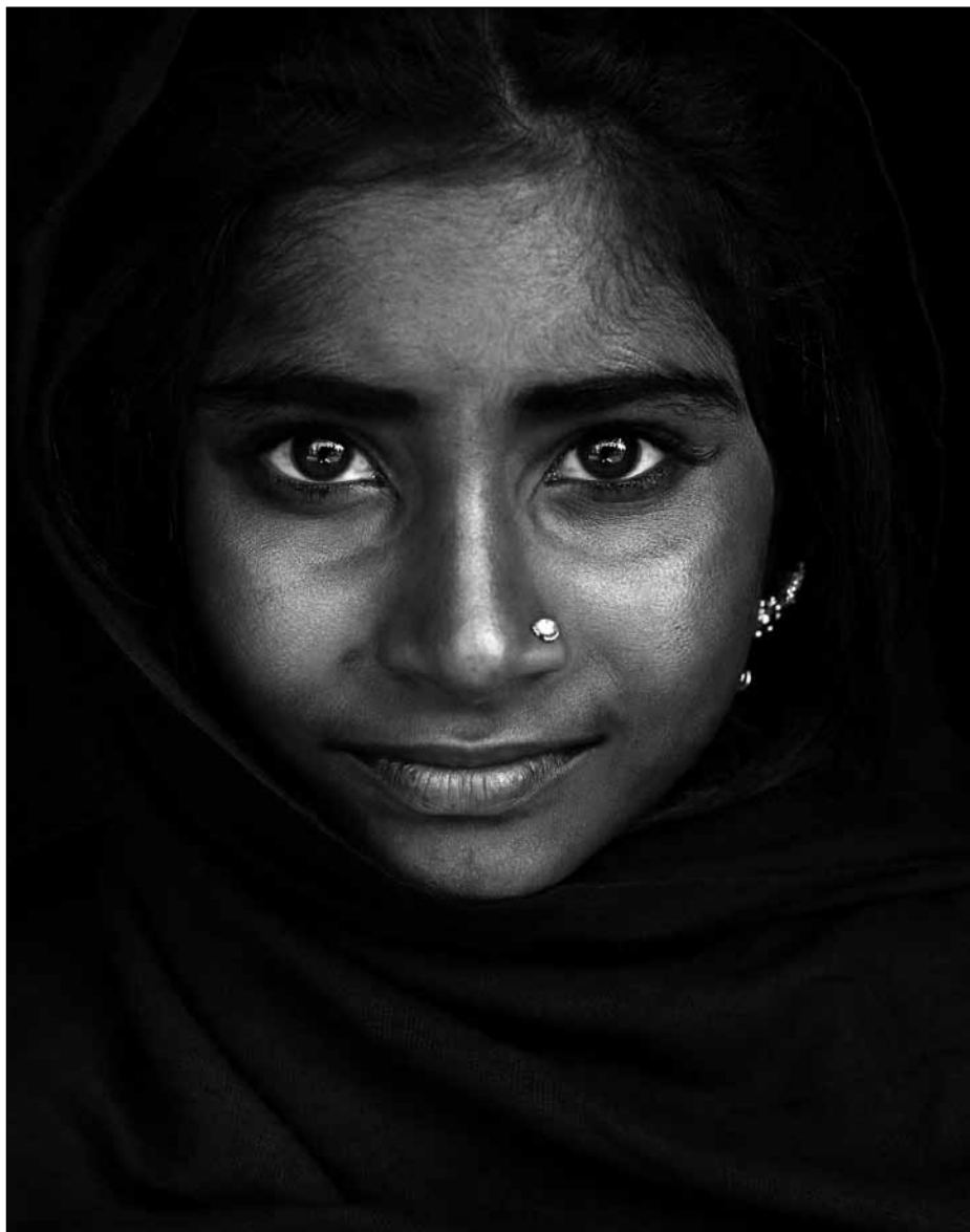
Portrait eines Gypsie Mädchens, Indien, 2014

Im Mittelpunkt seines Werkes steht der Mensch. Unermüdlich hat der Fotograf in den letzten Jahren auf zahllosen Reisen in die unterschiedlichsten Regionen der Welt seine ganz persönliche Galerie von faszinierenden Portraits zusammengetragen. Seine von Respekt und starker Empathie getragenen Aufnahmen sind nicht nur intensive Portraits, sondern sie geben zum Teil auch erhellende Einblicke in den Alltag der von ihm fotografierten Menschen und ermöglichen es dem Betrachter, Anteil am Leben des Portraitierten zu erhalten. So gelingt es dem Fotografen immer wieder, eine visuell verbindliche Beziehung zwischen dem Betrachter und dem Gegenüber herzustellen – trotz aller ethnischen und kulturellen Unterschiede. So fremd die Kleidung und Aufnahmeorte auf den ersten Blick auch erscheinen mögen, so vertraut wirken doch die in den Motiven eingefangenen Emotionen und würdevollen Posen. Mit seiner suggestiven und direkten Fotografie versucht Marino, den von ihm portraitierten Individuen ein möglichst authentisches Bild zu entlocken. Die Kamera erscheint nicht als störender Filter, sondern vielmehr als ein offener Spiegel. Im perfekten Zusammenspiel von Ausschnitt und Komposition sowie im virtuoson Umgang mit Schwarzweißkontrasten oder Farbkompositionen sind einzigartige Portraits entstanden. Diesen von Marino als »fotografische Psychogramme« bezeichneten Portraits kann