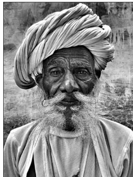
© Mario Marino, Portrait eines Farmers, Indien, 2013, (Original in Farbe)

Mario Marinos Werke wurden in den letzten Jahren von zahlreichen Galerien