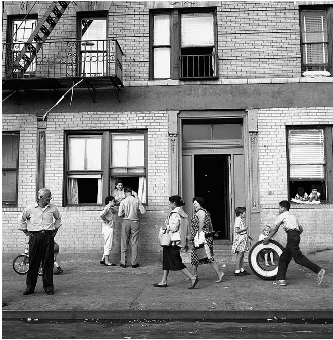
108th Street, East New York, 28. September 1959