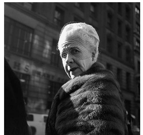
Uptown West New York, 26. Januar 1955