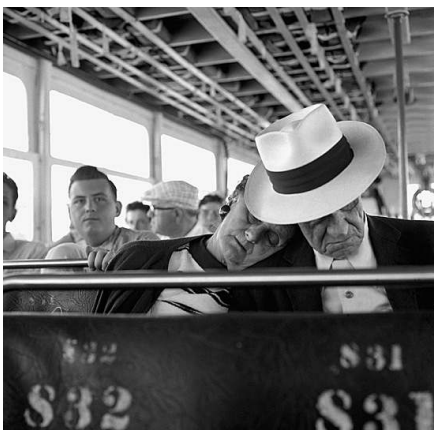
Florida, 7. April 1960