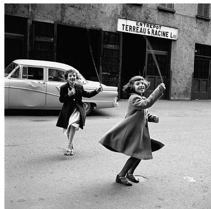
Kanada, ohne Datum