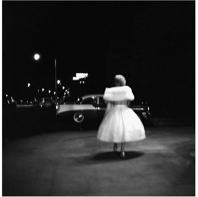
Florida, 9. Januar 1957

SCHATZ Fünfzig Jahre lang fotografierte eine Nanny Straßen in Amerika – und zeigte die Bilder niemandem