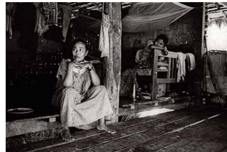
Im Uhrzeigersinn: Mangrovenwald an der Küste; die Baptistenkirche wurde 1920 von Missionaren errichtet; ein Mann der Ethnie der „Ranchie“, die vor 100 Jahren aus Zentralindien auf die Andamanen gebracht wurde, zwei Karen-Frauen vor einem typischen Holzhaus