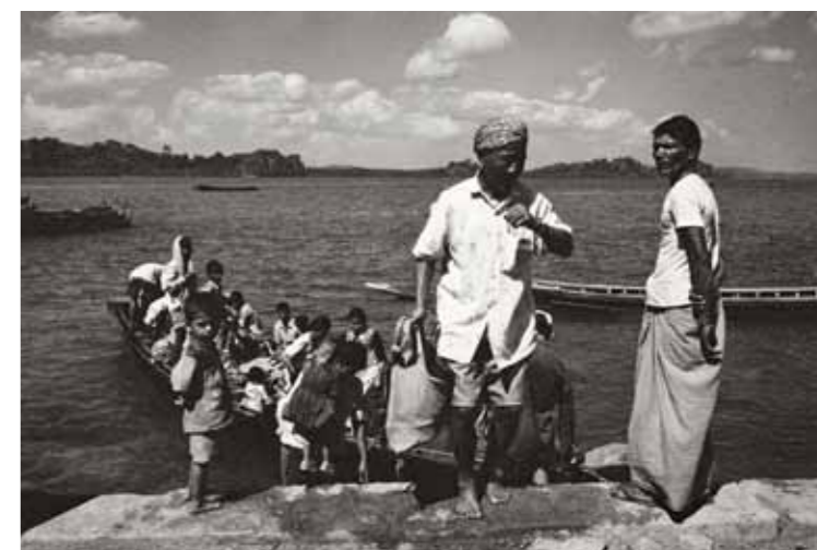
Im Uhrzeigersinn: einige Fischer am Anleger in Wandoor; Männer in einem typischen Einbaumkanu; am einsamen Strand vom Wandoor ruhen sich sogar die Rinder aus; Hafenszene in Diglipur, früher Port Cornwallis, dem Haupthafen der nördlichen Andamanen