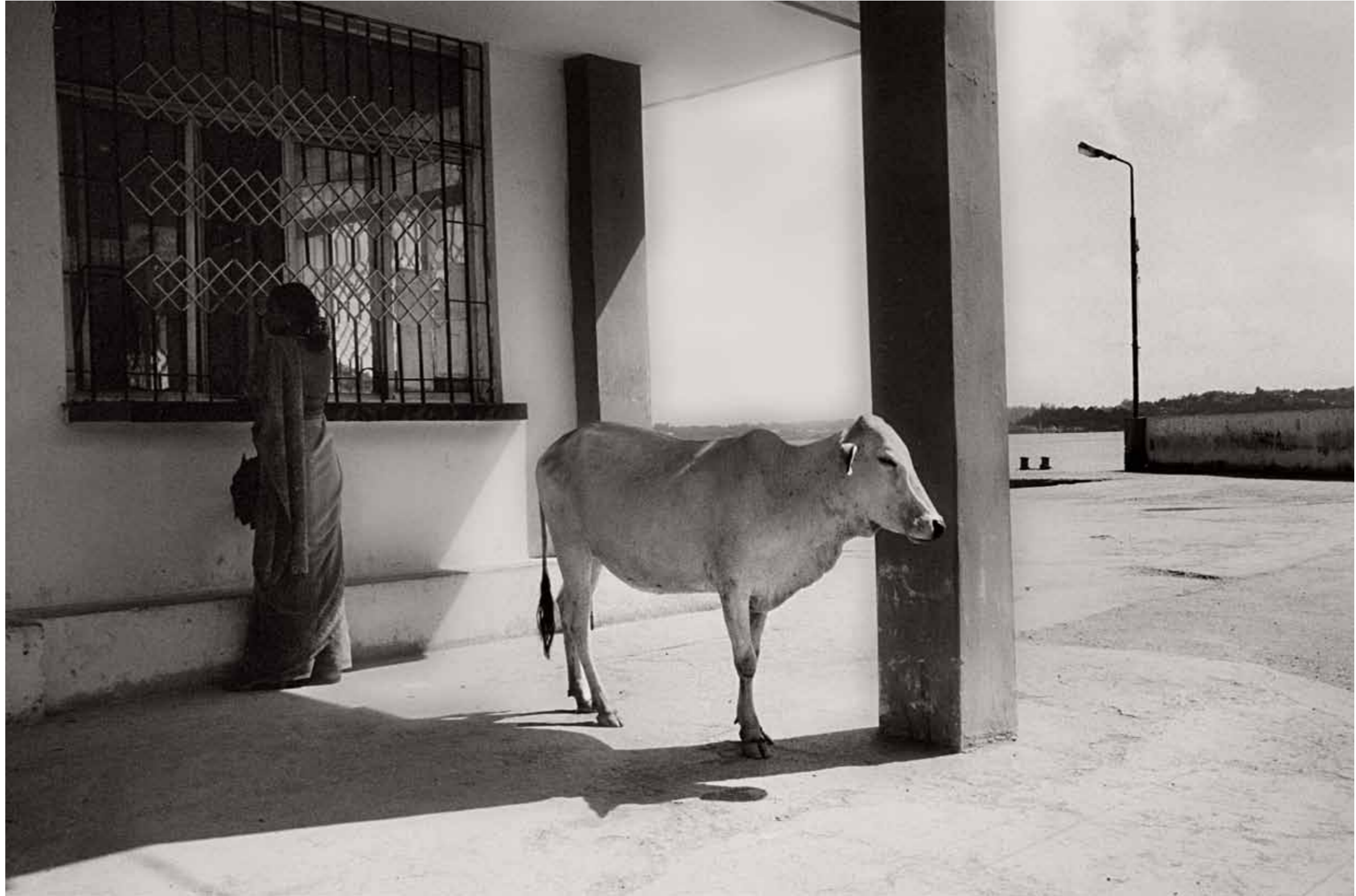
Im Uhrzeigersinn: Naw Popo ist eine der beiden Frauen, die das Dorf Chipo gründeten; eine Kuh am Anleger von Port Blair; altes Holzhaus einer anglo-karischen Familie in Port Blair; am Strand von Havelock Island